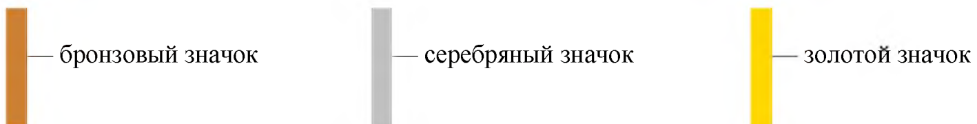
ТАБЛИЦА НОРМ ГТО — 3 СТУПЕНЬ( 11-12 ЛЕТ)